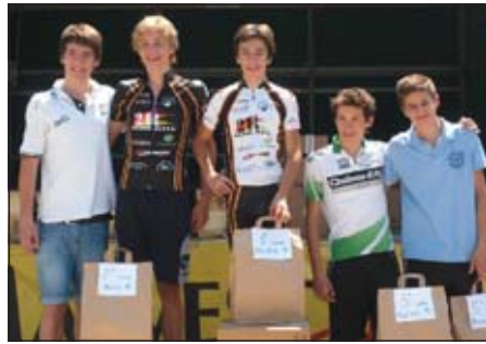
Il podio degli Allievi

Classifica a squadre: 1) Orobie Cup MTB 9.622 punti; 2) Scuola MTB San Paolo d'Argon 3.291 punti; 3) MTB Parre 2.406 punti; WR Compisiti Racing 2.371 punti; 5) San Paolo MTB 2.284 punti.