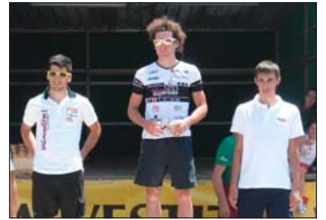
Il podio Elitesport