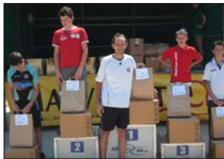
Gli Esordienti e, sotto, juniores