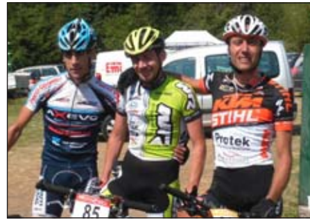
Il podio degli assoluti