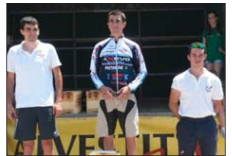
Il podio open e, sotto, quello delle società