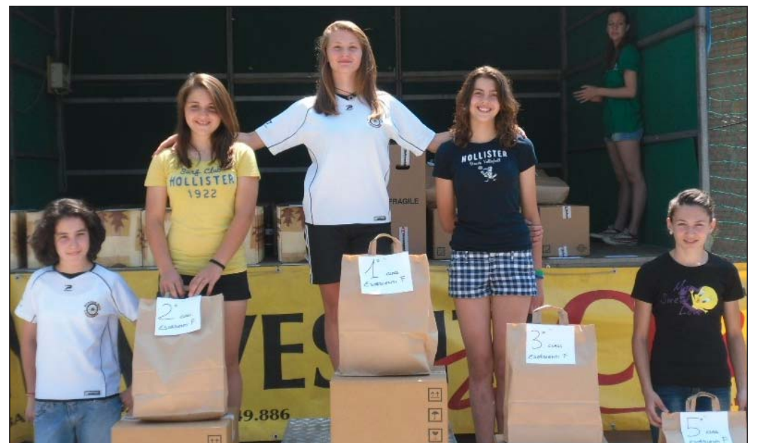
Il podio delle Esordienti a Palazzago